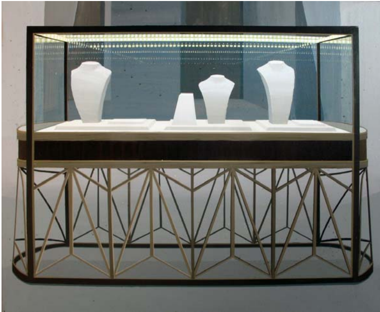
Escaparate II 2013 Acrílico sobre lienzo 81 x 100 cm.