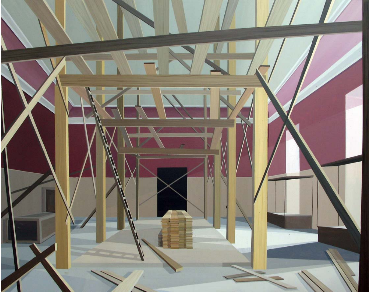
Arqueológico 2013 Acrílico sobre lienzo 162 x 130 cm.