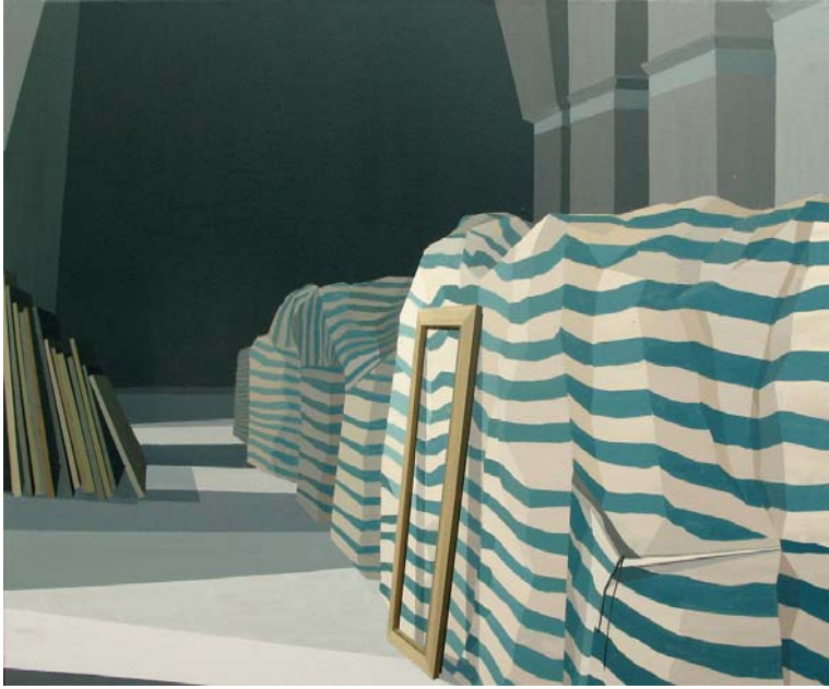
Prado 2013 Acrílico sobre lienzo 100 x 81 cm.