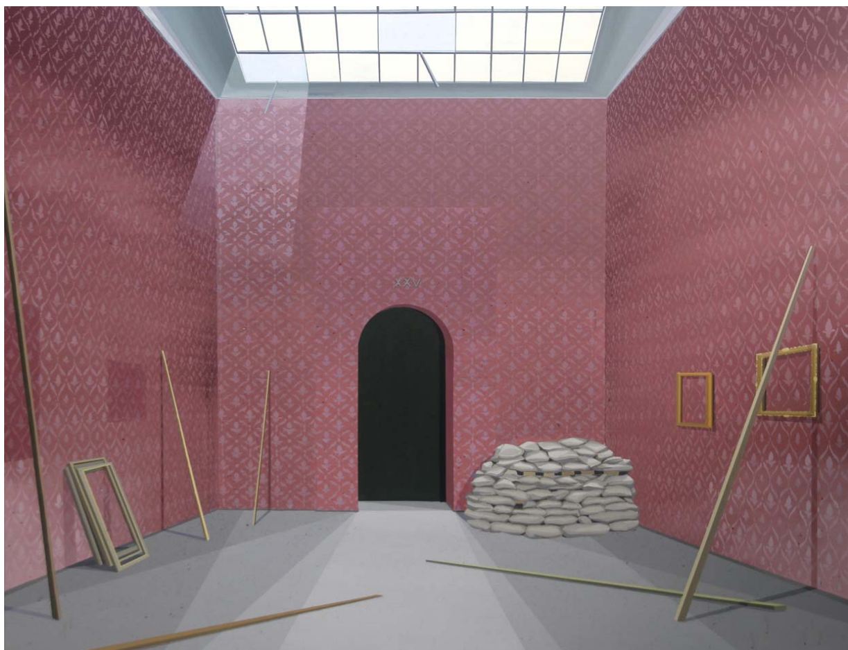
La trinchera 2013 Acrílico sobre lienzo 130 x 162 cm.