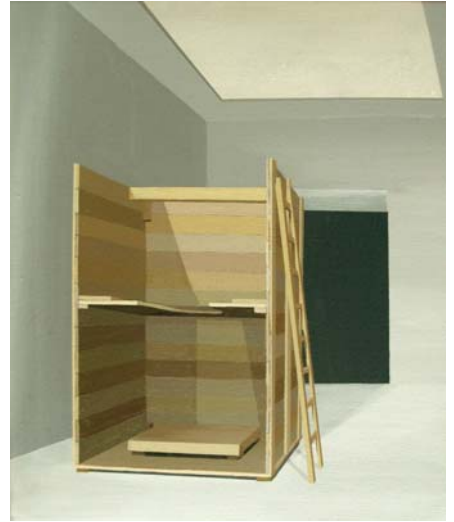
Louvre [Victoria de Samotracia] 2013 Acrílico sobre lienzo 46 x 38 cm.