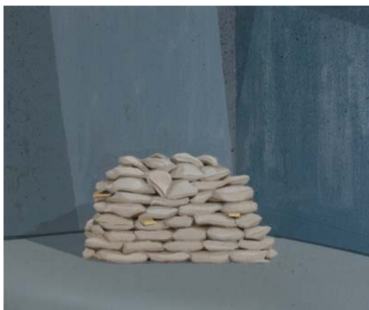
Prado [Trinchera] 2013 Acrílico sobre lienzo 38 x 46 cm.