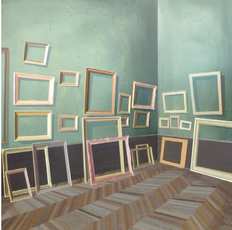
Louvre 2013 Acrílico sobre lienzo 100 x 100 cm.