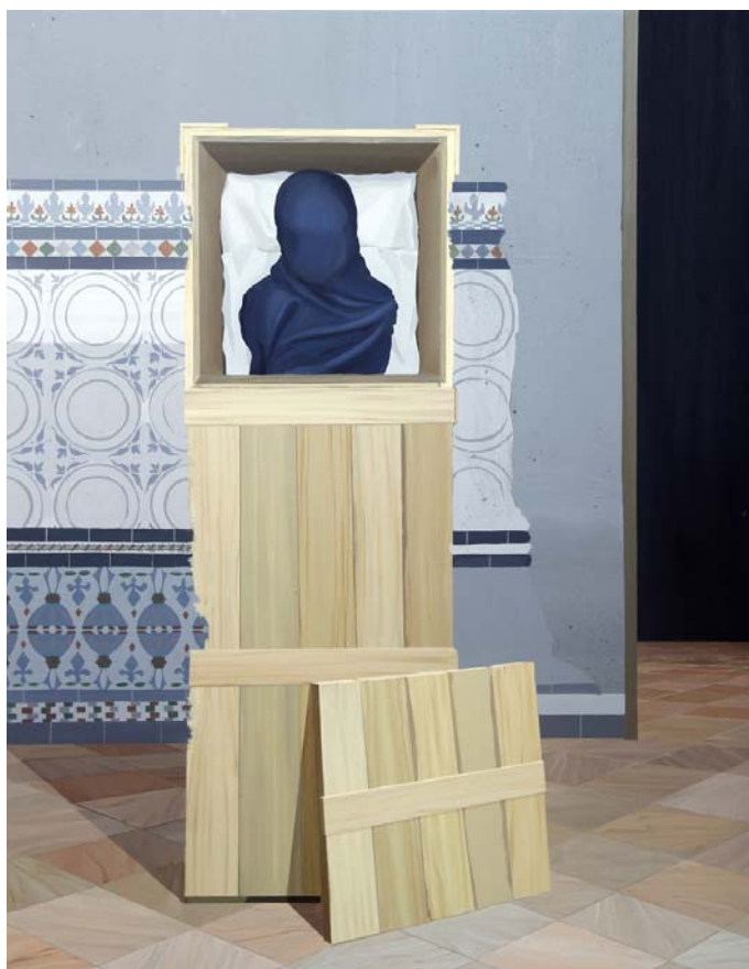
El traslado de la imagen 2013 Acrílico sobre lienzo 116 x 89 cm.