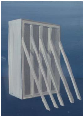
Serie «El traslado de la imagen» 2013 Acrílico sobre cartón 21 x 15 cm.