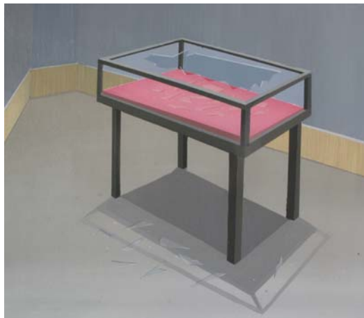
Irak [Vitrina] 2013 Acrílico sobre lienzo 41 x 46 cm.