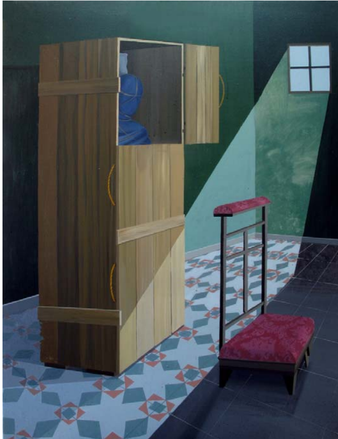
El traslado de la imagen II 2013 Acrílico sobre lienzo 116 x 89 cm.