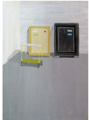
Serie «El traslado de la imagen» 2013 Acrílico sobre cartón 15 x 21cm. y 21 x 15 cm.