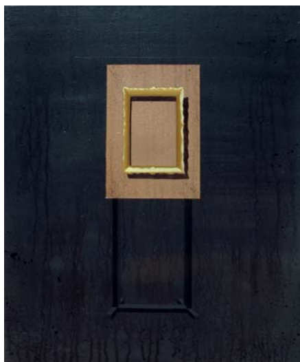
Gardner [The Concert] 2013 Acrílico sobre lienzo 46 x 38 cm.