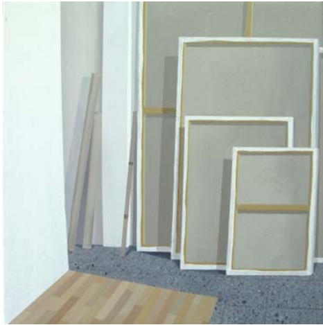
Estudio 2013 Acrílico sobre lienzo 41 x 41 cm.