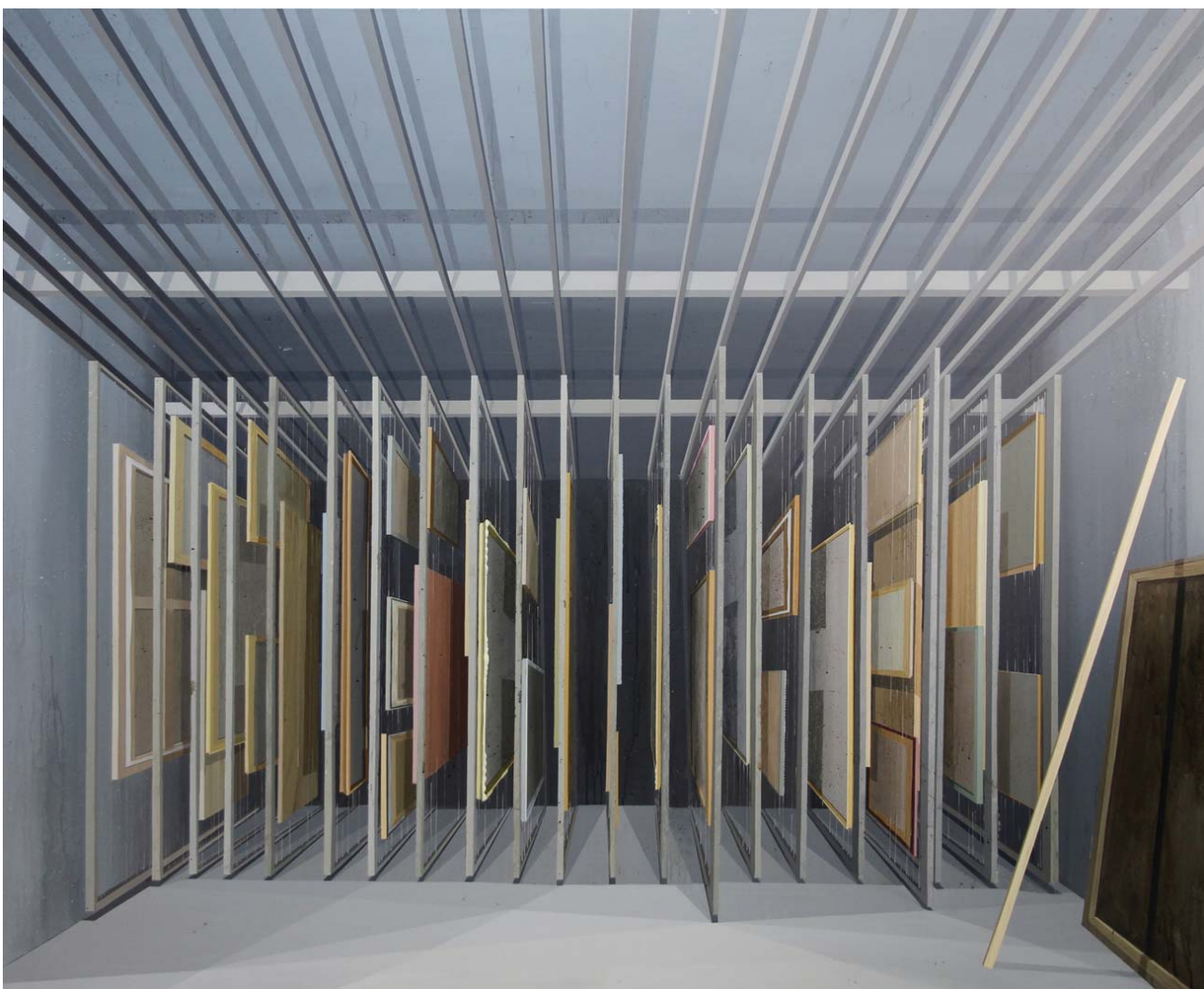
Peine 2013 Acrílico sobre lienzo 162 x 195 cm.